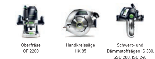
Oberfräse OF 2200

Ideal in Kombination mit den Absaugmobilen CTM* 26/36/48 mit und ohne AUTOCLEAN-Funktion und mit folgenden Werkzeugen: