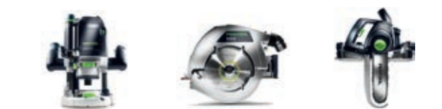
Вертикальный фрезер OF 2200

Идеальный выбор в комбинации с пылеудаляющими аппаратами Festool CTL/CTM* 26/36/48 с функцией AUTOCLEAN и без неё и со следующими инструментами: